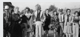
Beispiel für ein Graustufenbild